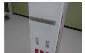
メディカルレール