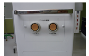
エアブレーキシステム