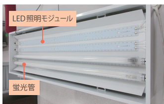
蛍光管を外してモジュールを取り付けます