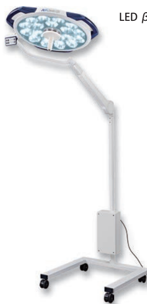
LED β500SC Mobile