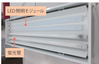
蛍光管を外してモジュールを取り付けます